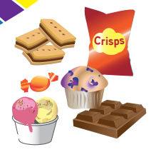
ХРАНИ СЪДЪРЖАЩИ ЗАХАР И МАЗНИНИ